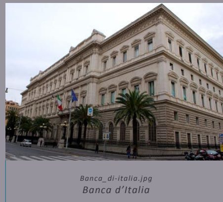
Banca_di-italia.jpg Banca d'Italia

Il nostro suggerimento, è quindi quello di affrontare con tenacia le varie problematiche che di volta in volta si presenteranno, cercando di monitorare costantemente gli andamenti dei rapporti con il sistema bancario.